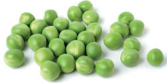
Bezelye / Pea بازلاء