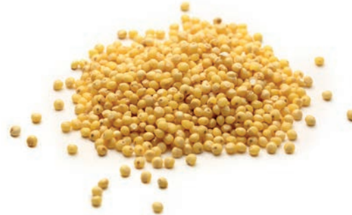
Sarı Darı / Yellow Millet دخن أصفر