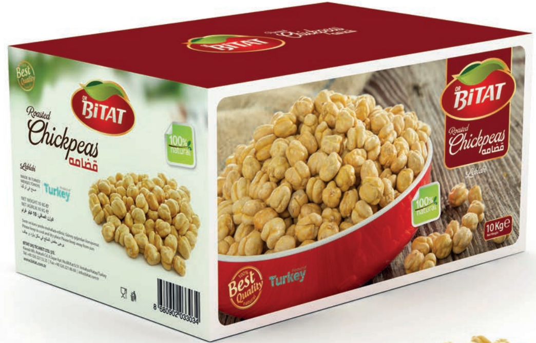
Leblebi / Yellow Chickpeas قضامة