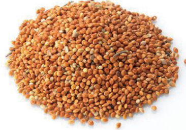
Kırmızı Darı / Red Millet دخن احمر