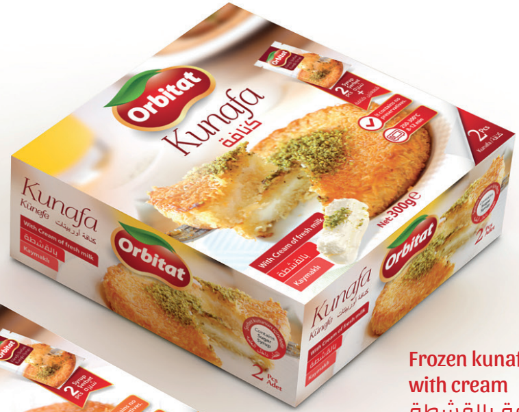
Frozen kunafa with cream كنافة بالقشطة 300gr x 12