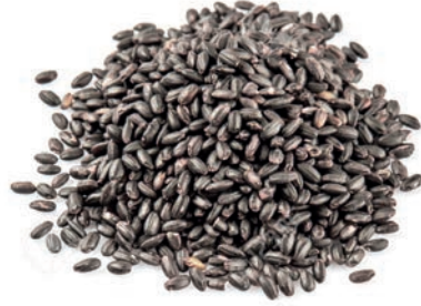
Siyah Darı / Black Millet دخن اسود