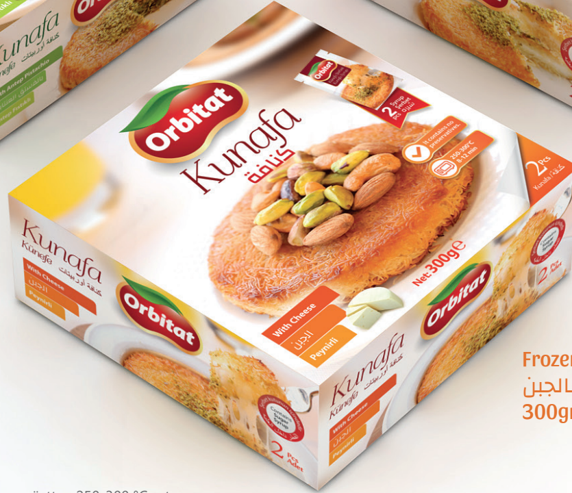
Frozen kunafa with cheese كنافة بالجبن 300gr x 12