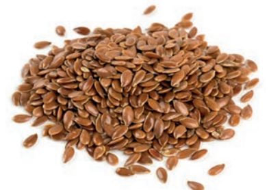
Keten Tohumu / Flaxseed بذور الكتان