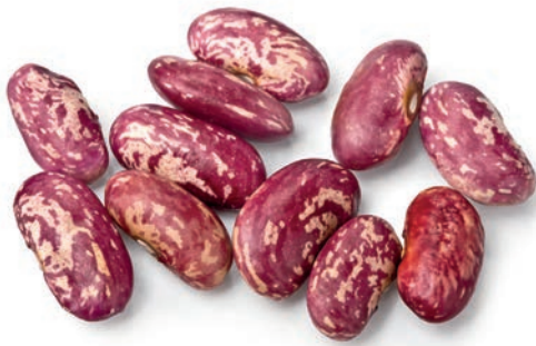
Barbunya Fasulye Kidney Beans فاصولیا حمراء