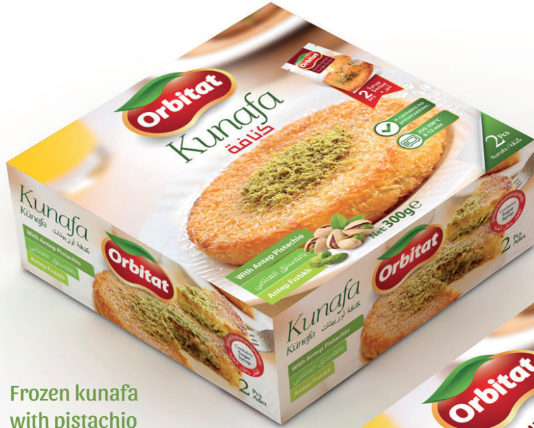
Frozen kunafa with pistachio كنافة بالفسق العنابي 300gr x 12