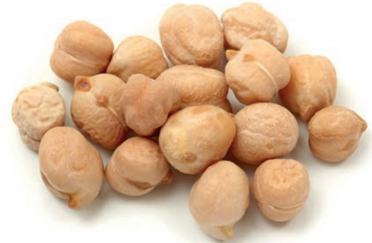
Nohut Chickpea حمص