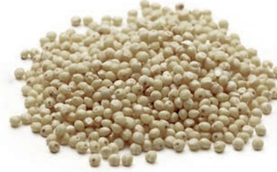
Beyaz Sorgum / White Sorghum ذرة بيضاء