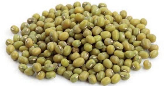
Mas / Mung مونج