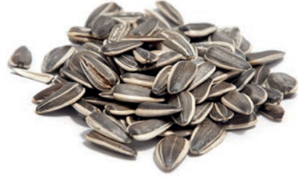
Ay Çekirdeği / Sunflower Seeds حب شمس