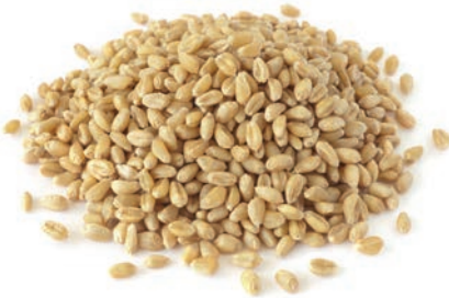
Arpa / Barley الشوفان