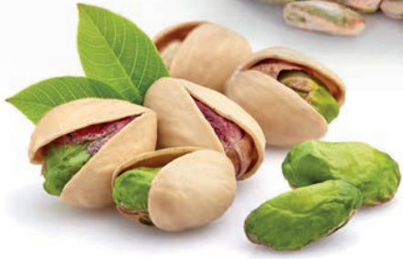
Antep Fıstığı Antep Pistachio فستق عنقابي