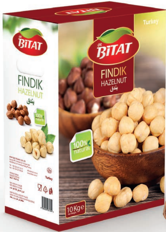
Findik / Hazelnut البندق