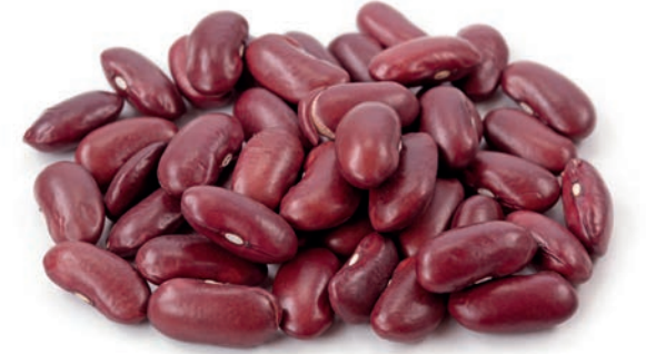
Barbunya Fasulye Kidney Beans فاصولیا حمراء