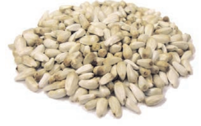
Aspir Tohumu / Safflower Seed حب شمس ابيض