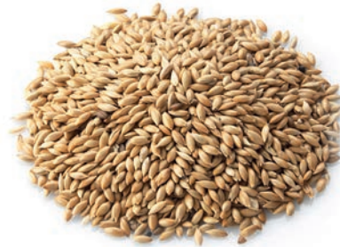
Kanarya Yemi / Canary Feed اكل كناري