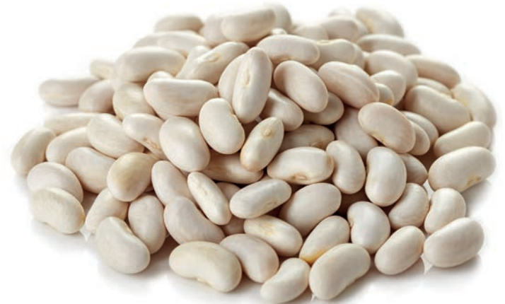
Kuru Fasulye White bean فاصوليا بيضاء