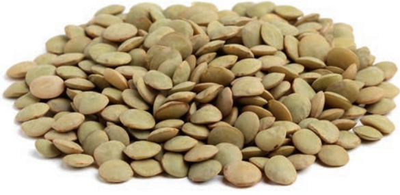
Yeşil Mercimek Green Lentil عدس اخضر