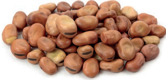
Bakla Broad Bean فول