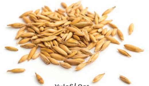
Yulaf / Oat شعير