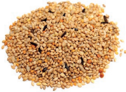
Ak Darı / Millets دخن